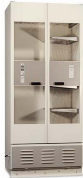
Modèle 330 avec étagères demi-largeur en option

Garantie totale de deux ans sur les pièces et la fabrication; un plan optionnel de garantie prolongée (pièces seulement) est disponible. Assistance technique sans frais par téléphone pendant toute la durée de vie de l'équipement. Les réparations sous garantie sont réalisées via la MERA (Medical Equipment Repair Association) ou par des techniciens biomédicaux internes.