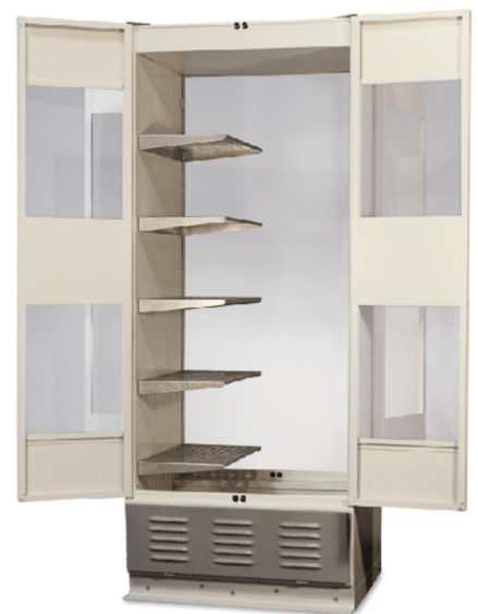
Modèle 340 avec étagères demi-largeur en option