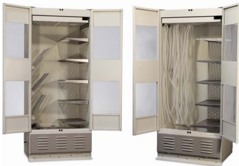
Modèle 330 avec étagères demi-largeur et support pour sachets et flacons en option