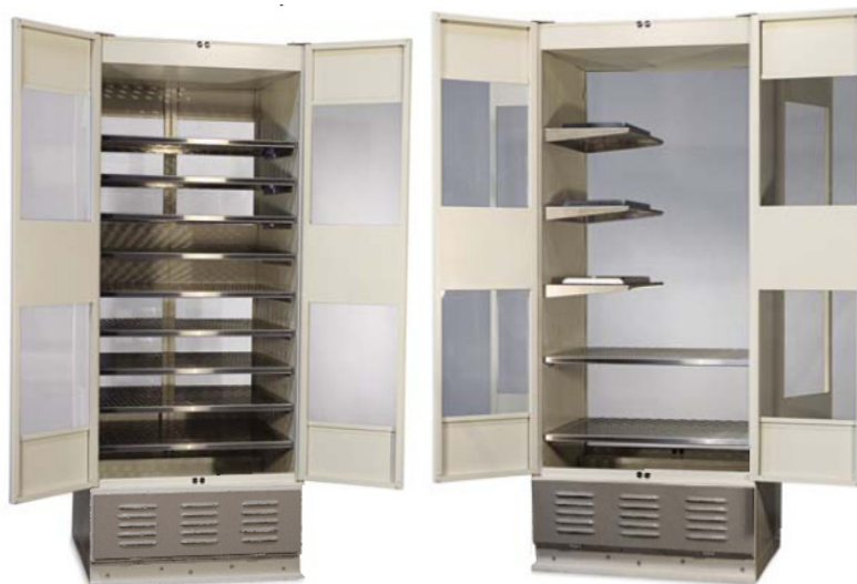
Modèle 340 avec maximum d'étagères pleine largeur en option