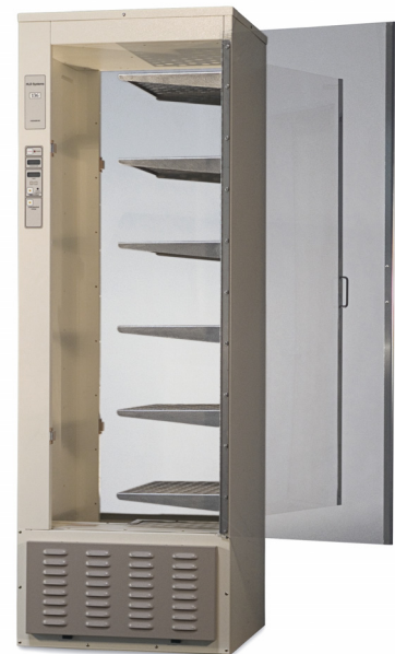
Modèle 136 avec étagères demi-largeur en option