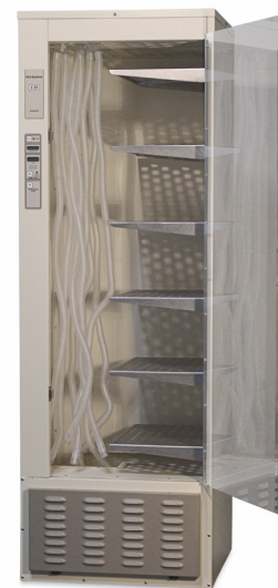
Modèle 135 avec étagères demi-largeur et supports de séchage de tubulure en option