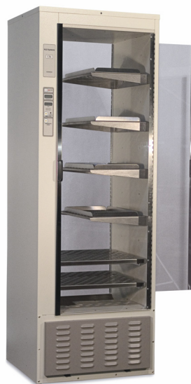
Modèle 136 avec étagères demi-largeur et pleine largeur ainsi que bacs pour petites pièces en option