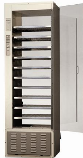
Modèle 136 avec maximum d'étagères pleine largeur en option