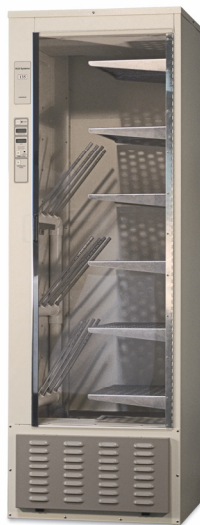
Modèle 135 avec étagères demi-largeur et support pour sachets et flacons en option